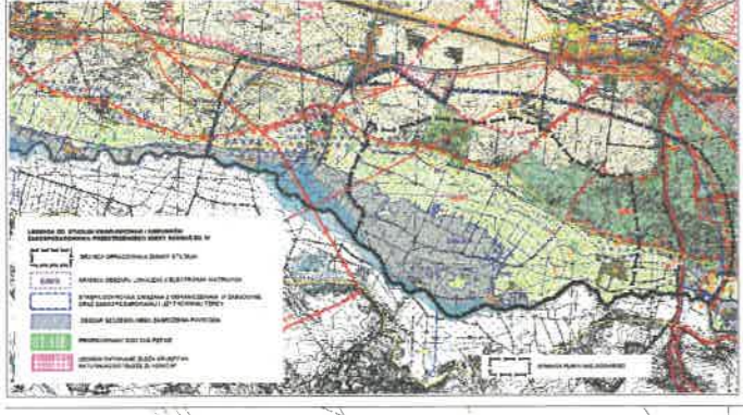
WYRYS ZE STUDIUM UWARUNKOWAŃ I KIERUNKÓW ZAGOSPODAROWANIA PRZESTRZENNEGO GMINY SUCHAŃ